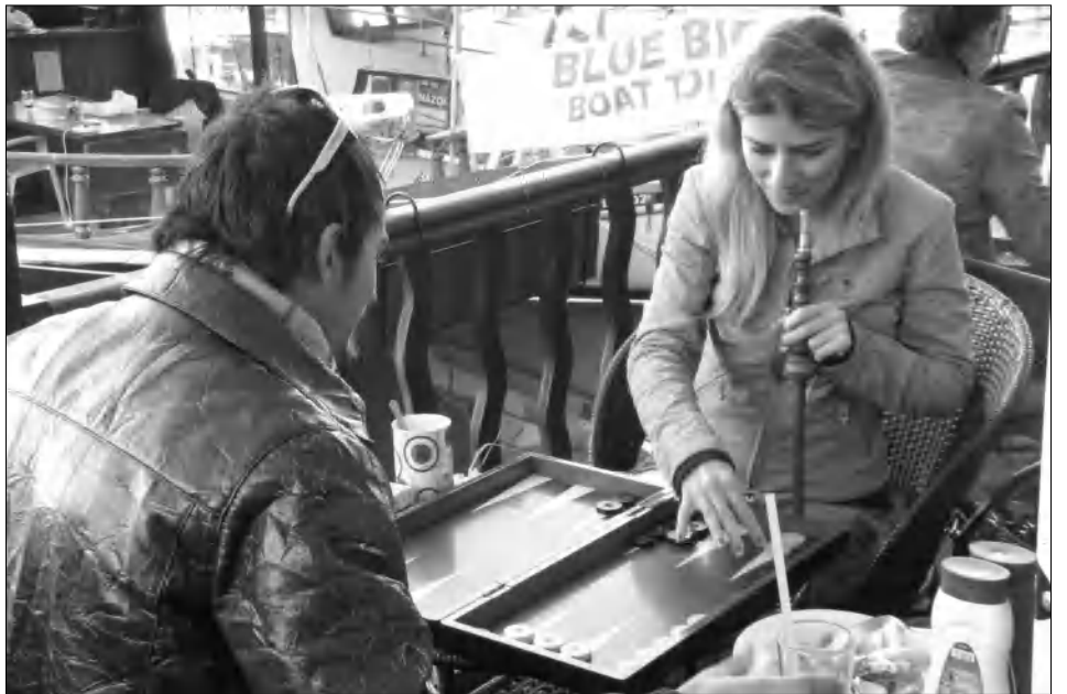
Հյուսիսային Կիրոսի թուրք գրաստանիկները

Վերաբնակված թուրքերի թվաքանակի եւ ոչ միայն այդ առնչությամբ հունական կողմից սարքեր կարծիքներ ունի թուրք-կիրական կող-