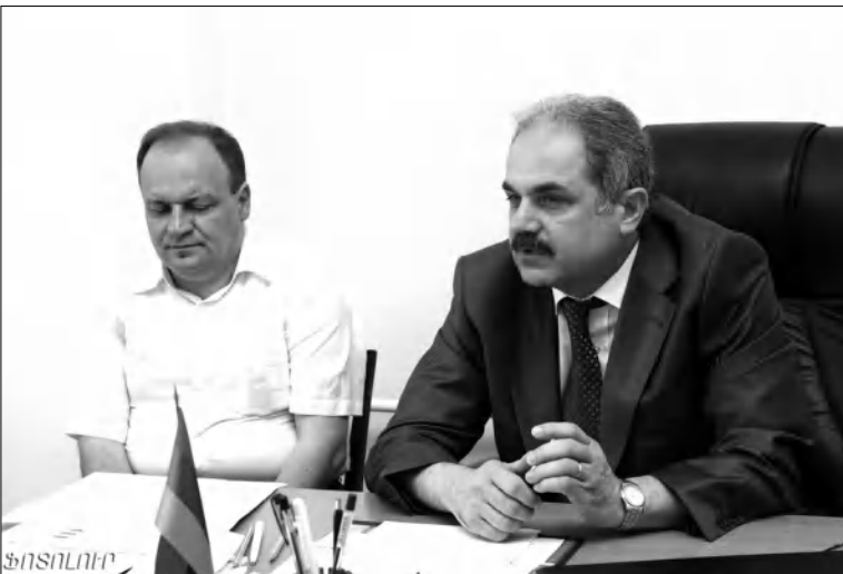
հաղթողը կդարձնեն 3000 դոլարով:

Առաջին անգամ այս հուամրցաբարում մասնակիցները հնարավորություն կունենան լրացնելու միջազգային գրումայստերի եւ միջազգային վարպետի մրցումները: Մրցանակային ընդհանուր հիմնարկում 15 հազար դոլար է, որը կբաշխվի լավագույն արդյունքի հասած 15 ժամանակակիցների միջև: Հասույթ դրամական դրույթներ են նախատեսված նաև ժամանակակիցների համար, մինչև 16 ամսական դասարանների եւ 60-ից բարձր տարիք ունեցող մասնակիցների մեջ լավագույն արդյունքի հասած ժամանակակիցների համար: Մրցաբարի