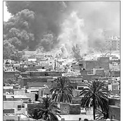
Լիբիայի վերաբերյալ ՄԱԿ-ի Ան րանաձեռն թույլատրում է հարվածներ հասցնել անմիջականորեն Մուամար Զադդաֆին: CNN հեռուստատեսության լուսանկարներում ներկայացված են Մուամար Զադդաֆիի և նրա ընտանիքի անդամների փախույթը Եգիպտոսից Լիբիա:

Թուրքիայի համար ճակատագրական, վճռորոշ որակավոր խորհրդարանական ընտրություններն այս օրերս վերջապես կհասնեն բուն փլեթարկությանը: Ամենայն հավանականությամբ ընտրողների գրեթե կեսը ընտրատեղամասեր կզման ամբողջական Թուրքիայի ներկայիս վարչապետ Ռեջեփ Թայիփ Էրդողանի «Արդարություն եւ բարգավաճում» կուսակցության վարկանիշը առնվազն մոտ 50 տոկոս ցածր էլու արդյունք: Ու չնայած այդ հեռանկարի ֆոնին ընտրությունների ելքը կանխորոշված է թվում, դեռեւս հարցական է իջնում կուսակցության սահմանափակ ձայների հանակը, ինչն էլ, ըստ էության, հունիսի 12-ի ընտրությունների հիմնական կռիվախնամն է: