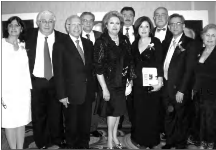
Լեզուն որով գրեցի՝ երկրի երեսը քիչեր