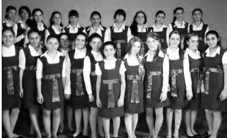
Դպրոցի մեծերի երգչախումբը

կան փառասոնի համբավ է ձեռք բերել: 2011-ի փառասոնն անցկացվում էր ԳԴՀ կանցլեր Անգելա Մերկելի հովանու ներքո: Աշխարհի տարբեր երկրներից, նաեւ Գերմանիայի տարբեր ֆաղափներից մասնակից երգչախմբերն ու անսամբլները մրցում են 15 անվանակարգերում, արժանանալով տարբեր երկրներից հրավիրված մասնագիտական ժյուրիի գնահատականին: 2011-ին մասնակցության հայտ էր ներկայացրել ավելի քան 40 երկրների 200 երգչախումբ եւ ազգագրական խումբ (բարևական, իգական, դասանական, մանկական, ժողովրդական): «Կոմիսսա»-ը ներկայացնում էր Հայաստանը: ՄԱՐԻԱՆ ՇԱՀԻՆՅԱՆ Գերմանիա