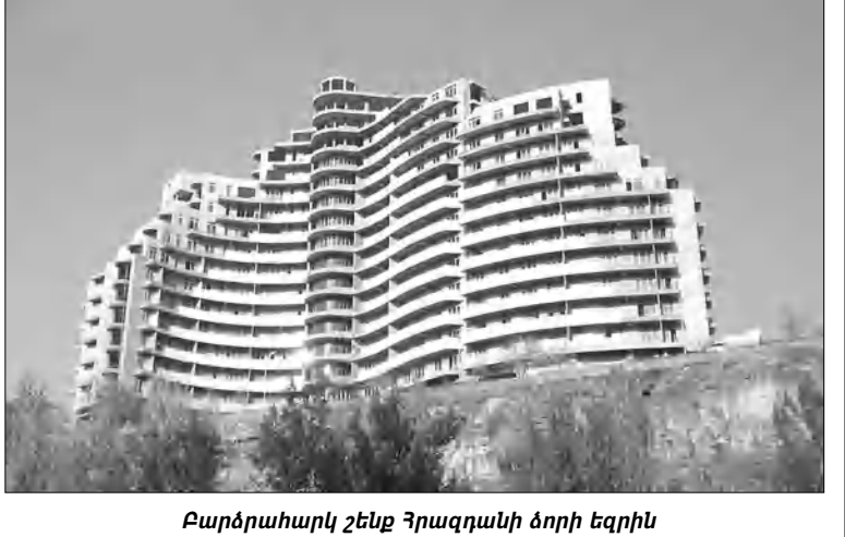
Բարձրահարկ շենք Հրազդանի ծորի եզրին

«Պե՛տ է գիտակցենք, որ Երևանը ճարտարապետական բարձրահարկ բնակարանները խիստ սակարկության ակ են: Վերջին երկրաշարժի ժամանակ էլ բարձրահարկ բնակարանները մեծ մասը դահված են: Մինչդեռ Հայաստանում բարձրահարկ բնակարանները հսկողությունը Երևանում է: Կառույցների խտությունը մեծ է: Օգտագործված են խիստ անկայուն և անկայուն և, որ եթե նույնիսկ բնակարանները մեծ, խտության ժամանակ եզերել փակող նյութերը կթափվեն, և կստեղծվի մի վիճակ, երբ փրկարարները չեն կարողանա մոտենալ՝ մարդկանց սահանելու համար», «ԱՁԳ»-ի հեղինակը պատմում է Մկրտիչ Մինասյանը: