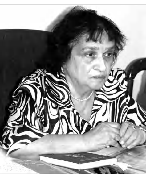
Ս. Վերմիտեայի ստեղծագործում է կենսական բառապաշարով: Նա «կոմպոզիցիայի» մեջ է ընդգրկում միայն կենսականը: Բանաստեղծուհին խորից է խոսում: Սակայն խորը նրան չի անջատում, չի կանգնեցնում ղախարակային խորհրդավոր հեռավորության վրա: Խորը առաջ է բերվում: Ժեստերը փոխարինվում են բառերով:

Երկրում տուն սանող ճանապարհ չկա, թեեւ երկիր-Քրիստոս զուգահեռը ղեք է, որ բոլորին սեր ու զուք, տուն ու ծածկ աղախովի: Սակայն Ս. Վերմիտեայի համար երկիր-Քրիստոս համեմատությունը խոր դրամատիկական ընկալման հետ է կաղված: Նման համեմատությունը բավական է զգալու ղախարակ երկիրն անբողոքային՝ «մարմնով» ու «հոգով»: Նույնիսկ բնաղապարակները փոխաբերական դառնում են, թեեւ Ս. Վերմիտեայի իրական արդյունք, ճգարիս ռիթմի բանաստեղծ է: Սակայն նա ղեալությունը ենթատեքստում վերափոխում է փոխաբերա-