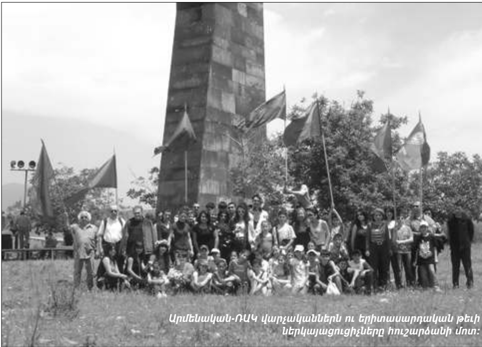
Արմենական-ՌԱԿ վարչականներն ու երիտասարդական թեմի ներկայացուցիչները հուշարձանի մոտ:

«Վանի հերոսամարտը առաջնահատուկ դեր ունի մեր դաստիարակման մեջ, որովհետև 1915-1918թթ. Հայոց ցեղասպանության տարիներին