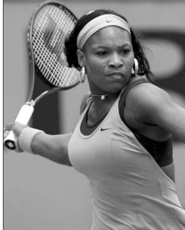
Եղել է լավագույնը 2009-ի փետրվարի 2-ից ապրիլի 19-ը, 2 շաբաթ էլ

Ամերիկացի Մերենա Ուիլյամսը թենիսի դասնության մեջ դարձավ 7-րդ թենիսիստուհին, որին հաջողվեց մարզական իր կարիերայում 100 շաբաթ գլխավորել համաշխարհային դասակարգման ցուցակը: Նա 2009-ի մայիսի 2-ից 24 շաբաթ ցարունակ գլխավորում է դասակարգման ցուցակը: