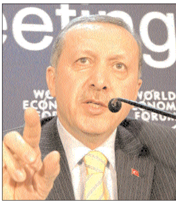
Ստույգան Արաբիա: Դեռևս հունվարի 18-ին Թուրքիայի արտգործնախարարությունը հաղորդագրություն էր տարածել՝ մասնաձեռնելու համար, որ Հայաստանի Սահմանադրական դատարանի ընդունած

ՀԱՆՈՒՆ ԶԱՐԲԱՆ: Հունվարի 12-ի միտումը ՀՀ Սահմանադրական դատարանը որոշ վերադասարկումներով հավանություն էր տվել դիվանագիտական հարաբերությունների հաստատման ելույթի երկրների միջև հարաբերությունների զարգացման հայ-թուրքական արձանագրություններին, նշելով, որ դրանցում ամրագրված դրույթները համապատասխանում են երկրի սահմանադրությանը: Սահմանադրական դատարանի որոշումն աշխարհում փնտրելուների տեղի սվեց Հայաստանում, իսկ Թուրքիայում առաջացրեց բուռն հակազդեցություն: Անկարան այնքան էր կարեւորել որոշումն նշանակությունը, որ Թուրքիայի արտգործնախարարը դրա դատարանի մի ֆունկցիոնալ ռուտինում էր ուղեւորվել: