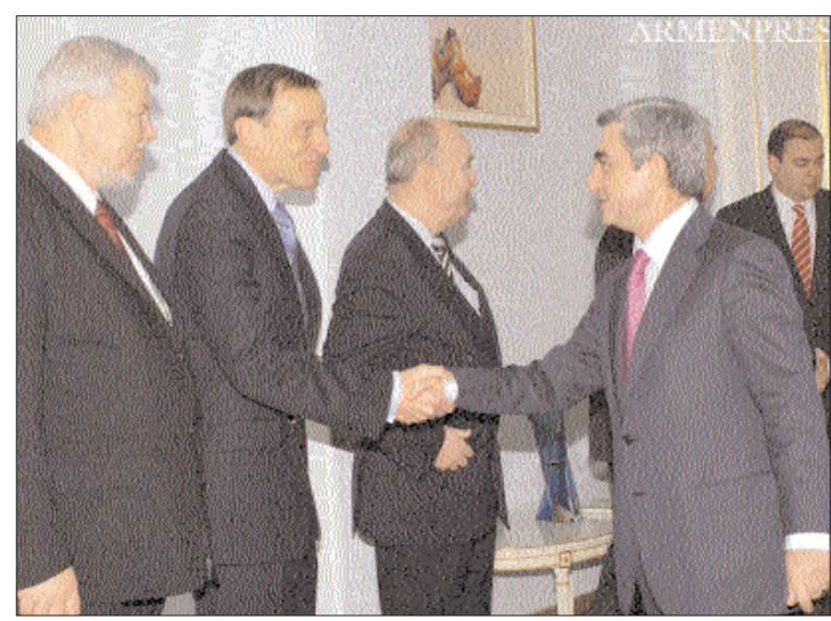
Երեկ ՀՀ նախագահ Սերժ Սարգսյանն ընդունեց Մինսկի խմբի համանախագահներին և ԵԱՀԿ նախագահի ներկայացուցիչ Կասպրիկին:

Հայաստանի նախագահ Սերժ Սարգսյանի աշխատանքային զբաղվում առաջիկա օրերի առնչությամբ որևէ նշում չկա նախագահի դատարանական կայքէջում, սակայն կարելի էր որևէ այցելության մասին տեղեկություն ակնկալել, ֆանի որ ԵԱՀԿ Մինսկի խմբի համախաղահների մակարակաղ արված հայտարարության համաձայն, հավանական է, որ Հայաստանի և Արդեթանի նախագահները հանդիմեն այս օրերը: Թեև այս օրերը կայանալիք հանդիման հավանականության մասին նշել էր ԵԱՀԿ Մինսկի խմբի ամերիկացի համանախագահը, սակայն, որոշ տեղեկությունների համաձայն, Հայաստանի և Արդեթանի նախագահները, Ռուսաստանի նախագահի մասնակցությամբ, կհանդիմեն հունվարի 25-ին Սոֆիում: