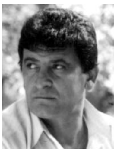
Մնացյալը՝ նոր լույս աշխարհ եկած «Հայելի» բանաստեղծական ժողովածուում: Մ. Խ.