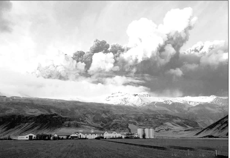
Մեկը չի կայացել: Սակայն, երկվա սլայներով, դեղի Եվրոպա 9 ուղիություններից 8-ը բաց էին՝ բացառությամբ Երեւան-Բեռլին ուղղության: Թռիչքների հետաձգման հետեւում Եվրոպայից Հայաստան չեն կարողանում հասնել 750 ուղևորներ, իսկ Հայաստանից Եվրոպա չեն կարողացել մեկնել 1140-ը: Ն. Չ.

«Եվրոկոնսոլ» գործակալության տեղեկացմամբ՝ ավիաընկերությունները մասնակիորեն վերականգնել են եվրոպական օդագնացության անվտանգությունը: Հնարավոր է որ վերականգնվի թռիչքների 60 տոկոսը: Մինչդեռ Փարիզի եւ Ֆրանկֆուրտի օդանավակայաններում որոշ թռիչքներ դեռ մնում են հետաձգված, իսկ Լոնդոնի օդանավակայանները փակ են Իսլանդիայից եկող նոր մոխրե ամոլի դասառնով: «Արմավիա» ընկերությունն, իր հերթին, տեղեկացնում է, որ ապրիլի 20-ից Երեւան-Յուրիխ-Երեւան, Երեւան-Ամստերդամ-Երեւան, չվերթները կկայանան՝ ըստ չվացուցակի: Ապրիլի 24-ին նախատեսված Երեւան-Օդեսա-Երեւան, ինչպես նաեւ Երեւան-Խարկով-Երեւան, Երեւան-Կիեւ-Երեւան չվերթերը նույնպես կհրականան: