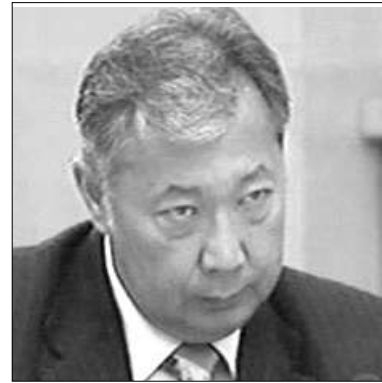
Նա օրս չեն խոչընդոտել Ղրղուսանի հարավում Բակիեի կողմնակիցների համահավաքների անցկացմանը: «Բայց ինչպե՞ս ենք մենք, որ նա փորձում է ժողովրդին կիսել հարավիցների եւ իյուսիսիցների», մտախոհություն է հայտնել Բեկնազարովը:

Նոր իշխանությունները Բակիեին եւ նրա մեծավորներին մեղավոր են համարում անցյալ շաբաթվա մարտի 13-ին Բեհլեյի դատարանի կողմից ձերբակալվելու նախագահի, նրա եղբայր ժամը Բակիեին եւ ավագ որդի Սարաթին: Կարգադրված է ձերբակալել նաև դատաւարության նախարար Բակը Կալբեյին, հասուկ ծառայության ղեկավար Սուրաթ Սուսալիմովին եւ արդեն հրաժարական սկսած վարչապետ Դանիալ Ուսեյնովին: