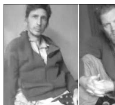
France3-ի աշխատակիցներին եւ նրանց երեք աֆղան ռուլեյցողներին առեւանգել էին 2009-ի դեկտեմբերի 30-ին Զաքարի շրջանում: Այս սարվա փերվարի կեսերին գրոհայինները հրատարակել էին առաջին սեւագրությունը: Թալիբները Սարկոզիից դատաւարում են, որ երկու ֆրանսիացիների ազատման դիմաց նա Վաշինգտոնին եւ Զաքարիին համոզի ազատ արձակել աֆղանական բանտերում դատաւար թալիբներին:

«Թալիբան» շարժման գրոհայինները հրատարակել են France3 հեռուստաընկերության դասանդ լրագրողներին հետ նկարահանված սեւագրությունը, որտեղ իրենք սղանում են սղանել առեւանգված ֆրանսիացիներին, եթե Ֆրանսիայի կառավարությունը չկատարի իրենց դատաւարները: Այդ մասին հաղորդում է «Ֆիգարո» թերթը: