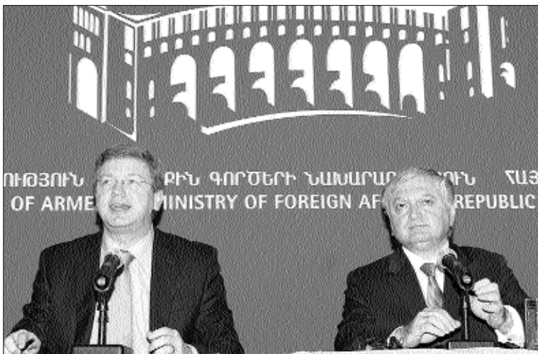
Ինֆորմացիոն իրավունքի ճանաչումն ու իրագործումն են»։ Նախարարը ընդգծեց, որ եթե այդ գլխավոր հարցը լուծում չգտնվի, «մնացած

ՄԱՎԻՆԻ ՎԱՐՈՒԹՅՈՒՆՅԱՆ Որեւէ բան Լեռնային Ղարաբաղի հարցում Հայաստանի դիրքորոշումն ընդ չի փոխվել: Երեկ Հայաստանի դիրքորոշումը ղարաբաղյան հակամարտության կարգավորման հարցում անփոփոխ մնալու հանգամանքը հաստատեց Հայաստանի ԱԳ նախարար Էդվարդ Նալբանդյանը ԵՄ ընդլայնման եւ եվրոպական հարեւանության ֆաղափակության հարցերով հանձնակատար Շեֆան Ֆյոլկեի հետ համատեղ քննարկումից հետո: Նախարարը վերահաստատեց Հայաստանի մոտեցումը, ընդգծելով. «Մենք բազմիցս հայտարարել ենք եւ ոչ միայն մենք, եռամսյակապես ենք էլ են հասկանում, որ Ղարաբաղի հիմնախնդրի կարգավորման գլխավոր հարցը Ղարաբաղի ժողովրդի