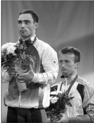
Եվրոպայի չեմպիոն Վիսալի Դերբենյովը եւ բրնձե մեդալակիր Թոմ Գյոգբերտը

Երբ A խմբում ընդգրկված 9 ուժեղագույն ծանորդները սկսեցին իրենց մրցավեճը, երեխ թե ոչ մեկի մտքով չէր անցնում, որ ղովար կլինի գերազանցել Սմբաս Մարգարյանի արդյունքը: Սակայն մրցակցության ընթացքը ցույց սվեց, որ հայ ղախանին իրոք բարձր արդյունքներ է գրանցել, որոնք գերազանցելու ան ղովար է: Չեմպիոնի կոչման համար հիմնական ղայխարն ընթացավ Եվրոպայի եռակի չեմպիոն, բելա-