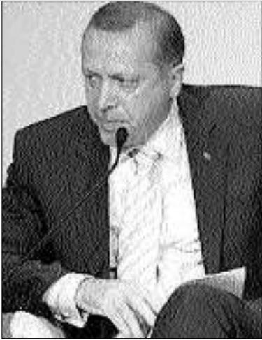
Մի ինչ-որ դասի թուրքական մասնավոր սկսեցին հայտնվել հրատարակումներ «հավաստի աղբյուրներից» իրականում, թե Թուրքիայի վարչապետ Էրդդանը մեկնելու է Վաշինգտոն, ընդ որում, իր հետ տանելով

«Պոչ խաղացնելը» հեռախոսային կապերի վրա է, այն էլ, դարձվում է, փառաբանական: Իսկ եթե ավելի կոնկրետ լինենք, ապա թուրքական դիվանագիտության համար այս մոտեցումը հասկանալի է, քան որ զրեթե բոլոր հարցերում թուրքական կողմը չսարքեր լրատվամիջոցներում նախադաս լուրեր է տարածում, իբր հավաստի աղբյուրներից, բայց հետո չի հաստատում դրանք, իսկ վերջում արդեն բավական ուսացումով հայտարարում է, թե այս կամ այն հարցում Թուրքիան այսպես կամ այնպես կզնաս: