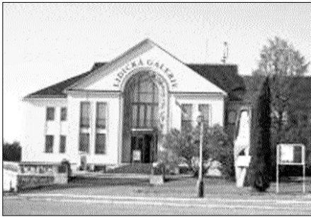
Լիդիայի թանգարանի շենքը

Չեխիայում Ադրբեջանի դեստանի թափառողները իր ձախողված գործունեությունն ադրբեջանցիներին համար կախվել է փոփոխությունից: Այդ նմանակով ադրբեջանական Day.az ինտերնետային կայքին դարակազմի մեկնաբանություն է սվել՝ կաղված չեխ լրագրողի Դանա Մազալովայի հայաստանյան այցի ընթացքում հնչեցրած մտքերի և չեխահայ համայնի գործունեության հետ: Հիշեցնենք, որ Մազալովայն Երևանում կայացած ասուլիսում իբրև ակամասես փաստել էր, որ ադրբեջանցիները Չեխիայում ֆարգազական նմանակներով չեխեր է օգտագործել Լիդիայի իտալական մայրի խորհրդանիշը, որ չեխեր է կեղծել ստեղծագործությունները և կեղծել իրենց չեխերի հետ կապված լուսանկարներն ու տեսաձայնները, որոնք նկատահարել էր հե-