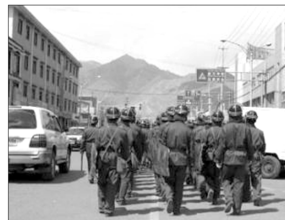
Տիրեթում ժամանակավորապես դադարեցված է: Պեկինում չեն մոռացել, որ երկու տարի առաջ հակաչինական ցույցերը վերաճեցին խռովությունների եւ չին-Տիրեթական բախումների: Տարբեր աղբյուրների համաձայն, սղանվեց մի քանի տասնյակից մինչեւ 200 մարդ:

1959 թվականի մարտին հակաչինական արդարաբանության ձեռնարկը հետո ԶԺ՝ իրականությունները ամեն սարվա մարտ ամսին նախագուսական միջոցներ են ձեռնարկում Տիրեթում: Այս տարի ձեռնարկվել է առնվազն 400 մարդ: Տիրեթի կենտրոն Լիասայի եւ Նեոլայի մայրաքաղաք Կասմանդուի միջեւ օդային հաղորդակցությունը ժամանակավորապես դադարեցված է: Պեկինում չեն մոռացել, որ երկու տարի առաջ հակաչինական ցույցերը վերաճեցին խռովությունների եւ չին-Տիրեթական բախումների: Տարբեր աղբյուրների համաձայն, սղանվեց մի քանի տասնյակից մինչեւ 200 մարդ: