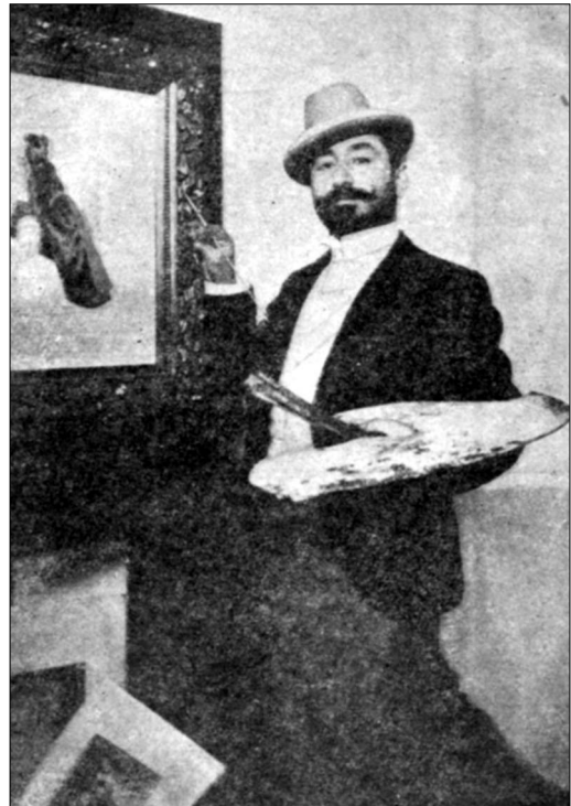
Վարդգես Սուրենյանց, 1899

գեղանկարչության սարերը՝ զուգորդված նկարչի նուրբ գունազգացողությամբ: Սուրենյանցի որոշ գործերում նկատելի է «մոդեռն» ոճի ազդեցությունը՝ դասական թեմատիկա, այլաբանություն, զարդանախիչ ընդգծված ոճավորում: Մոդեռնի գծերն ավելի ակնհայտ են «Սալոնե» կսավում, որտեղ նկարիչը Սալոնեին դասկերել է ոչ թե արդեն ավանդական դարձած տարբերակով՝ դարձելիս, այլ հակառակը՝ մեմակ, բայց իր մեմոլայան մեջ հղաւր ու անւարճ: Այստեղ Սալոնեի հավաքական