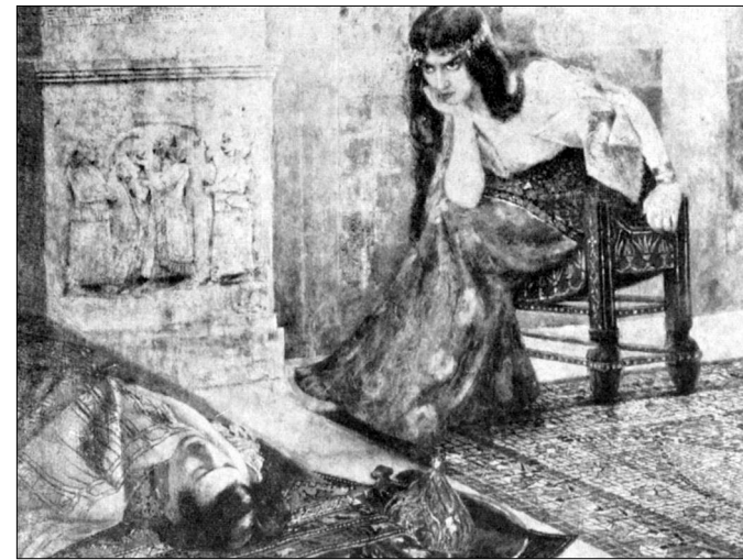
Շամիրանը Արա Գեղեցիկի դիակի մոտ