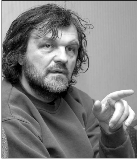
Panarmenian.net կայքը ստեղծված է, որ Էմիլ Կուսուրիցան արդեն այցելել է Սերբիա Փարազա-

«Արվեստի կարիք ունեն միայն փոքր ազգերը, ինչպիսիք են հայերն ու սերբերը: Մենք դարձավոր ենք դաժակալի մեր մշակույթն ու հավասար: Իսկական արվեստի դասընթացը ժամանակակից աշխարհում էս է փոքր է: Օրինակ՝ աներկյան ֆիլմերը հաշվարկված են լայն հանդիսատեսի համար, դրանցում չի կարող խոսք գնալ իսկական արվեստի մասին», երեկ մամուլի ասուլիսի ժամանակ ասաց սերբ ռեժիսոր Էմիլ Կուսուրիցան :