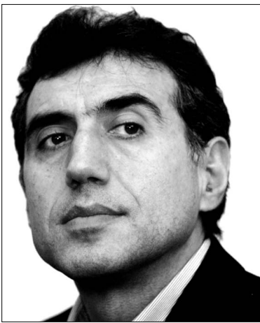
Պար: Գուցե ժամանակն է թարմ ուժեր ընդգրկել հավաքականում:

- Այս սարին մեծ նշանակություն է հավաքականների համար արգասաբեր չէր: Աշխարհի քիմիային առաջնությունում, համախառնային օլիմպիադայում չհաջողվեց նույնիսկ մրցանակակիր դառնալ: Ի՞նչ է սա. նահանջ, թե՞ ժամանակավոր դա-