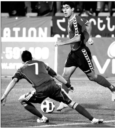
Ֆուտբոլի Եվրոպայի առաջնության ընտրական մրցաշրջանում ՀՀ հավաքականի մրցակիցներից բոլորից բարձր տեղ է գրավում Ռուսաստանը,

ՖԻՖԱ-ն հրատարակել է ազգային հավաքականների դասակարգման հերթական ցուցակը: Հայաստանի հավաքականը մայիսի ամսվա համեմատ մեկ հորիզոնականով նահանջել է՝ 46-նետուելայի ընտրումն հեծ բաժանելով 60-րդ տեղը: Հիշեցնենք, որ մեր հավաքականի համար լավագույն ցուցանիշը հոկտեմբերին գրանցված 59-րդ հորիզոնականն է: 73 հավաքականը 2010-ը սկսել էր 102-րդ տեղում եւ սարին ավարտեց 60-րդ հորիզոնականում: Առաջընթացն ակնհայտ է: Հիշեցնենք, որ 2009-ը մեր հավաքականն ավարտել էր 100-րդ տեղում, 2008-ին 113-րդ տեղում էր: Մինչև ընթացիկ մրցաշրջանը լավագույն արդյունքը գրանցվել էր 1999-ին, երբ մեր թուրքիսները սարին ավարտել էին 85-րդ հորիզոնականում: