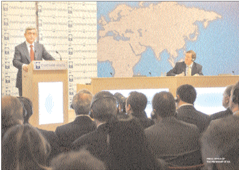
Վելի հայ ժողովրդի համար կարեւոր է Լեռնային Ղարաբաղի հիմնախնդրի լուծման ճանապարհին, մի հին-միայնակի, որ ամաստի մեծ ցավ ու կորուստներ է բերել իմ ժողովրդին»: «Մենք ակամասես ենք եղել ամեն

Հայաստանի նախագահ Մերժ Սարգսյանը երեկ՝ փետրվարի 10-ին, ելույթ է ունեցել Մեծ Բրիտանիայի Միջազգային հարաբերությունների բազմակուրական ինստիտուտում՝ «Չաթեն Հաուզում»: Ելույթը վերնագրված է՝ «Անվճանգությունն ու արժեքները Հարավային Կովկասում»: