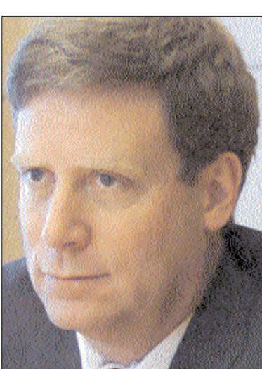
13 միլիարդանոց կարողությամբ Ջորջ Սորոսը 50 մեծ բարեգործների ցանկում զբաղեցնում է 6-րդ տեղը. նա բարեգործությամբ

2009 թվականին ԱՄՆ-ում ամենահարուստ բարեգործը միլիարդատեր Ջորջ Սորոսի որդի Սթենլի Դրյուկեն-միլլերն էր սիկնոց՝ Ֆիոնայի հետ: Նրանք իրենց բարեգործական հիմնադրամին փոխանցել են 705 մլն դոլար: Մինչդեռ Forbes համադեպի կազմած 400 ամենահարուստ ամերիկացիների ցանկում Դրյուկեն-միլլերը զբաղեցնում է ընդամենը 85-րդ տեղը եւ ունի 3,5 մլրդ դոլար կարողություն: «Սիթի թայմս» թերթը նույն է, որ «Ֆորբս» կազմած 400 ամենահարուստ ամերիկացիների ցանկում 2009-ին միայն 17 անձինք (ցանկի 4 տոկոսը) են սեփական միջոցներով ակտիվորեն ներդրել բարեգործության մեջ: Նրանք հայտնվել են ԱՄՆ 50 ամենաշատ բարեգործների ցանկում, որն ամեն արդի կազմում է Chronicle of Philanthropy հրատարակությունը: