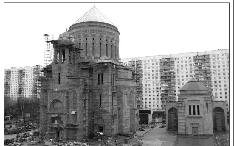
Շինարարությունն ընթանում է թափով: