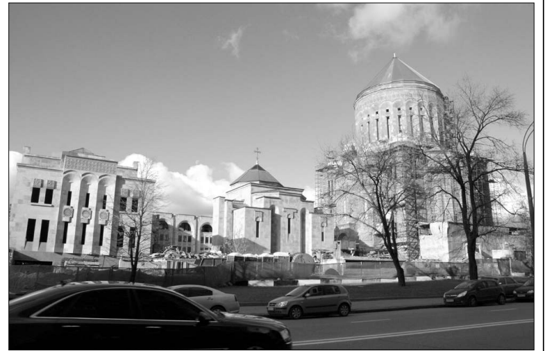
Եկեղեցական համալիրի մակերեսը: