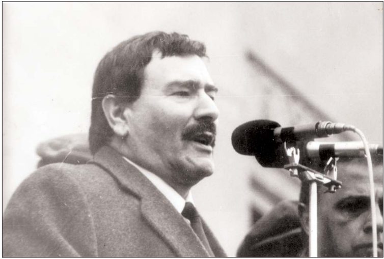
Թատերական հրապարակ 27 փետրվար, 1988:

«... Աղում եմ համբուրել Ձորիի ճակատը այն բանի համար, որ սովորեցնում է մեզ, թե ինչպես դիմել է սիրելի հայրենիքը»: