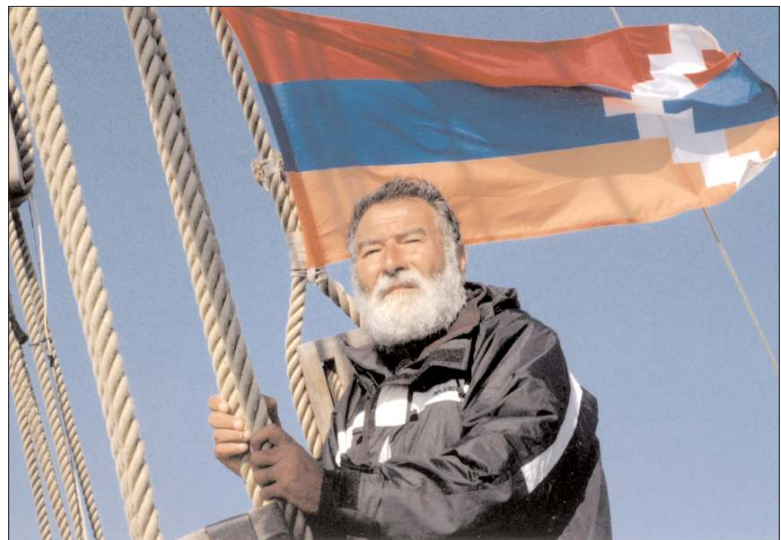
«Կիլիկիա. Ղարաբաղյան դրոշակակիր»