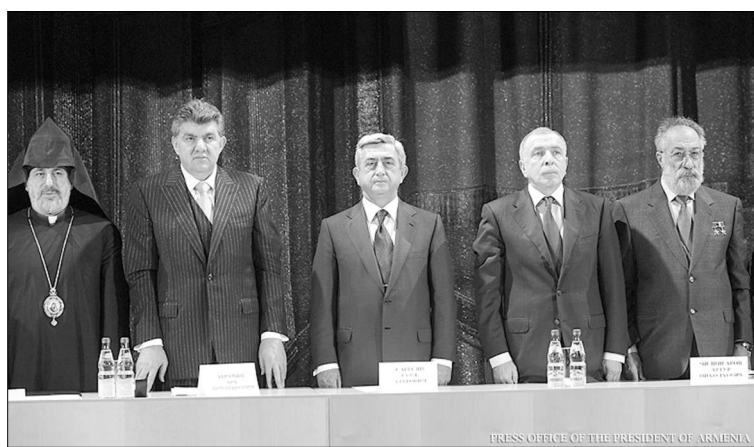
PRESS OFFICE OF THE PRESIDENT OF ARMENIA