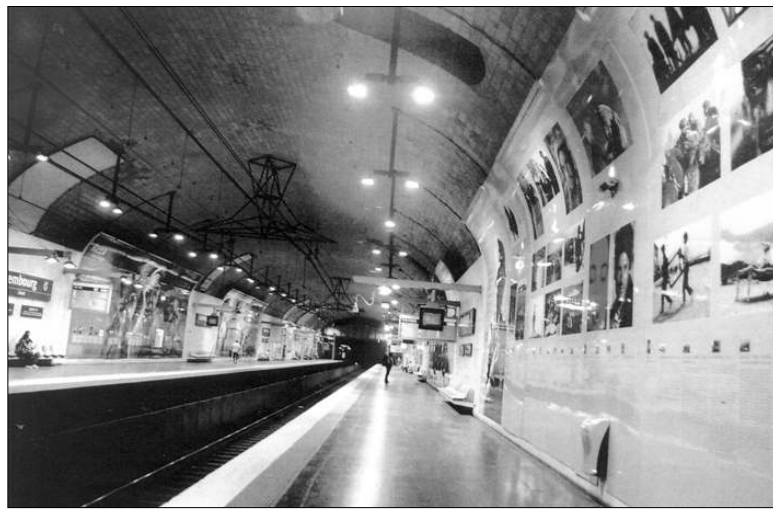
Փարիզի «Ռոզա Լյուսեմբուրգ» մետրոյի կայարանը դարձել է Ռեզայի հակահայ բարոգչության ցուցադրավայրը:

Պարբերական նմաստավոր նազանկան գործողություններ ձեռնարկած հանրադատության ինֆորմացիոնության ուժերը խաղաղ բնակիչների միջանցք սրամարտիցին նազանկան գործողությունների գոտուց արտահոսվող տայնաներում հեռանալու համար: Այդ մասին արբեջանական կողմը նախօրոք սեղեկացվել էր: Սակայն Արբեջանի իշխանությունները ոչինչ չարեցին խաղաղ բնակչությանը դուրս բերելու համար: Ավելին, բնակիչների բարայունը գնդակոծվեց Ադրանի Երջանում: Նախագահ Մուսթաֆայի հաստատեց Պասահարը, Պասասխանավությունը բարդեցվել իր երկրի ընդդիմության վրա, որը փորձել էր այդ ձեռով իրեն հեռացնել իշխանությունից: