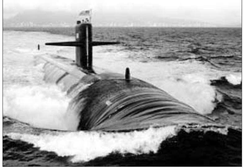
Միջնորդ Գուամի բնակիչները վախենում են, որ շինարարությունը կվնասի կղզու էկոհամակարգին եւ զբոսաշրջության վրա իմունված ճեսեստությանը: Դասձառումները ցույց են տալիս, որ շինարարության ընթացում կղզու 173 հազարանոց բնակչությունը 50 տկոսով կավե

լանա: Շինարարության ավարտից հետո ճաղոնական Օկինավա կղզուց այստեղ կբերվեն ծովային հեսեսակի 19 հազար զինծառայողներ: ԱՄՆ օրջակա միջավայրի դասձառումության գործակալությունը զգուցանում է, որ շինարարությունը կղզում կարող է առաջացնել ջրի զգալի անբավարարություն: Բացի դրանից, ծովի հասակի խոռացման աշխատանքները կարող են վնասել 300 ֆառ. մեթր կորալային խութերի: