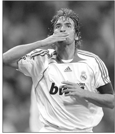
Վաթի մրցաշրջանում: Լավագույն ռեկորդի ռեալիստ 64 գոլակով եզրափակում է Անդրեյ Շեչեչենկոն:

«Շալկե-04-ի» կազմում չեմպիոնների լիգայի հերթական խաղում 2 գոլ խփելով Իսրայելի «Չարդեղի» դարձած, իսպանացի Ռաուլը Եվրոպայի գավաթների մրցաշրջանում իր գոլերի թիվը հասցրեց 70-ի եւ գերազանցեց ժամանակակից Մյունխենի «Բավարիայում» հանդես եկած անվանի ռեկորդի Գերդ Մյուլլերի ռեկորդը: Վերջինս Եվրոպայի գավաթների մրցաշրջանում 69 գոլակ էր խփել (35՝ չեմպիոնների գավաթի, 20՝ գավաթակիրների գավաթի, 11՝ ՌեՖԱ-ի գավաթի, 3՝ Սուպերգավաթի մրցաշրջանում): Ռաուլն իր նախորդ 68 գոլերը խփել է «Ռեալում»: 69 գոլ նա խփել է չեմպիոնների լիգայում, 1 գոլակ է իր օգտին է գրանցել Սուպերգավաթի մրցաշրջանում: