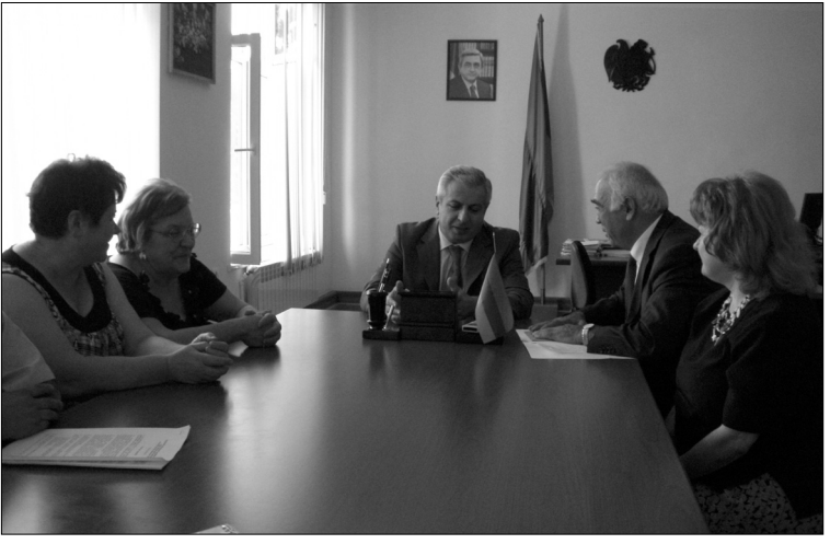
Զննարկում Վայոց ձորի մարզպետարանում

Փառատոնի նպատակն է Հայաստանի դպրոցականներին առավել ակնկալուն հաղորդակից դարձնել ռուս ժողովրդի մշակութային եւ հոգեւոր արժեքներին, նրանք Ռուսաստանի, ռուսական մշակույթի եւ ռուսաց լեզվի նկատմամբ նրանց հետաքրքրություն բարձրացնելու եւ դրանով իսկ աջակցել Հայաստանում ռուսական մշակույթի եւ ռուսաց լեզվի վարկի բարձրացմանը, Ռուսաստանի, որտեղ Հայաստանի ռազմավարական գործընկերոջ նկատմամբ ստեղծված բարեկամության հասարակական կարծիքի դասակարգմանն ու հետագա խորացմանը: