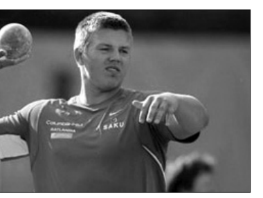
Էսոնացի մարզիկը հանդես է եկել Աթենքի և Պեկինի օլիմպիական խաղերում, աշխարհի եւ Եվրոպայի առաջնություններում:

Էսոնացի գնդապետը Տաավի Պետերսի համար Տամուկա լճում ձկնորսությունը ողբերգական ավարտ ունեցավ: Ձկնորսական նավակը շրջվեց ու մարզիկը լճում խեղդվեց: