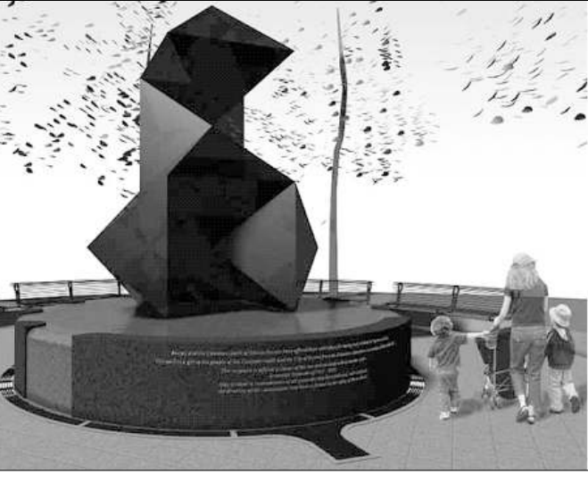
Հուժարձանի եւ շրջակայքի մակերեսը

Ամենայն հայց հայրադեժի Գարեգին Երկրորդի նախագահությամբ կատարվել է Բոսնիի եղերնի հուժարձանի օրհնության եւ հիմնադրարքի արարողությունը: Վեհափառ հայրադեժը Բոսնի է ժամանել սեպտեմբերի 9-ին: Գաղութի բոլոր կազմակերպությունները՝ «Հայկական ժառանգության այգիի հիմնադրարք» անվան ակ, աշխատել են 6 սարի շառնակ եւ հաղթահարելով թուրքական խոչընդոտները՝ ձգտել են իրականություն դարձնել Եղերնի հուժարձանի կառուցումը: Արարողությանը ներկա են եղել Մասաչուսեթսի նահանգադեժի Դոմինո Մարտիկը, Բոսնիի փաղապատես Թոմաս Սեմիոնը, նախկին նահանգադեժ եւ նախագահական թեկնածու Ջորջ Դոմինիկոն, ռեժական, փաղապատես բազմաթիվ ներկայացուցիչներ, նաեւ 2 հազարի հասնող մեր հայերնակիցները: Հուժարձանի կառուցման աշխատանքները, որոնք շուտով սկսվելու են, կավարժեն մի քանի ընթացում: Ի. Պ.