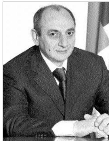
ԼՂԳ նախագահ Բակո Սահակյանը Պաշտպանության բանակի սեղանների 6-ին սեղի ունեցած ռազմական խորհրդի նիստում էլույթ է ունեցել:

Նեցել, որտեղ անդրադարձ անելով Ադրբեջանի կողմից զինադադարի ռեժիմի խախտումներին՝ դրանք որակել է որոշ ահաբեկչական-դիվերսիոն գործողություններ, որոնք ստանալիք են ոչ միայն սարածաշառի, այլև ողջ ֆաղափակիթ աշխարհի համար: Նա շեշտել է, որ ազգեստի կանխումն անենց արդյունավետ միջոցն ուժգին հակահարվածն է, եթե դա չկատարվի, ապա անկայունության սահմաններն անդաման կընդլայնվեն: Պաշտպանության բանակի մարտունակության աստիճանը նա բարձր է գնահատել՝ որոշելով լավագույն ադրբեջանցիների արդյունավետ կատարումը: Նա Ջրաբերի ուղղությամբ սեղանների 4-ի ադրբեջանական դիվերսիոն-հետախուզական խմբի կատարման համար դեմահան զարգացնել է հանձնել մի խումբ զինծառայողների: Մ. Խ.