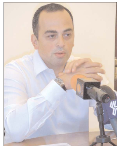
Նեստուր բավականին հայտնի բրենդ ներկայացնող ընկերությունները:

Վրաստանի Ազարիայի Ինքնավար Հանրապետության Ծովափնյա ֆաղափներն ու փոփոխ ավանները ամռան ամիսներին արդեն ֆանի տարի հայաստանցի զբոսաչառիկների թվաքանակը չեն զգում: Ընդամենը մի քանի տարի առաջ Ազարիայի հիմնական հանգստավայրեր Բաթումն ու Ջորջիայեթը ավելի օտար գյուղական ավաններ էին իրենցում, որտեղ միակ տարբերությունը սովորական վիճակից ծովի ու գեղեցիկ բնության համարությունն էր: