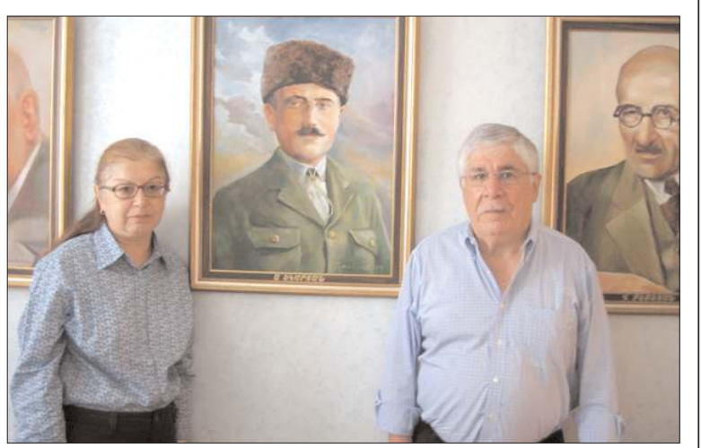
Արմենիկ էր Գուրգա Եկարյանները՝ Արմենական-ՌԱԿ գրասենյակում, Վանի հերոսի սկարի առջև։