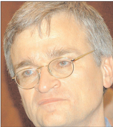
Որ: ԵՄ ներկայացուցիչն ընդգծել է, որ չլուծված հակամարտությունների կարգավորումը տարածաԵրջանում ԵՄ առաջնահերթություններից է:

Չարավային Կովկասը Եարունակում է մնալ անկայունությամբ ու անհաստատությամբ բնութագրվող տարածաԵրջան, եւ միջազգային հանրությունը դեմ է Եարունակի ներգրավվածությունը մասնավորադես հակամարտությունների կարգավորման ու ժողովրդավարության բարեփոխումներին աջակցության հարցում: ԵԱԳԿ մԵսական խորհրդում երեկ այս մասին հայտարարել է Չարավային Կովկասում ԵՄ հասուկ ներկայացուցիչ Պիտեր Սեմներին :