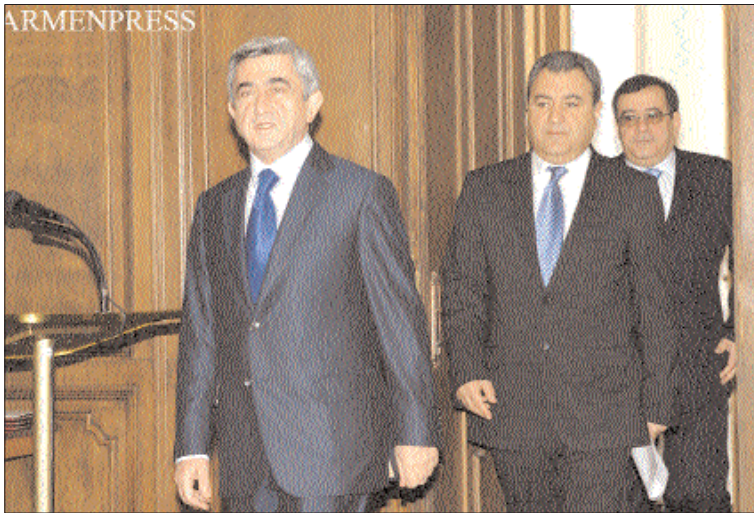
ԱՐՄԵՆՊՐԵՑՍ Սարգսյանը՝ չմոռանալով նաեւ նեել, թե մյուս կողմից էլ միեՑ չէ, որ թերությունը բավարար է մար-դուն ֆրեական ղասասխանաս-վության ենթարկելու համար: ՎՊ-ն ղեֆ է հեՑեղական լինի՝ վե-րացնելու բացահայՑված թերու-թյունները, սարսեսասկ ճնշում-ներին եւ խնդրամֆներին Ցեղի չՑալու վարձագիծ դրսեւորի: «Բո-լոր երկրներում ղեֆական միջոց-ների նկասմամբ ոՑնձգությունը հանցագործություն է: Սեր երկրում դա կրկնակի հանցագործություն է, ֆանի որ մեմֆ բազմաթիվ չլուե-ված խնդիրներ ունեմֆ եւ ղիՑի կարողանամֆ արդյունավեՑ ծախ-սել մեր հարկասունների միջոցնե-րը, առավել արդյունավեՑ թկագ-րեր իրականացնել ղեֆական մի-ջոցներով: Այդ միջոցների նկաս-մամբ ոՑնձգությունը ոՑնձգու-թյուն է մեր սերունդների նկաս-մամբ», ասել է նա՝ ավելացնելով, թե ղեֆական միջոցներ վասնող ղասեՑոնյաները ղեֆ է հանրու-թյան արգահասանֆին արժանա-նան, իսկ այդղիսի մթնոլորՑ ձե-ավորելու գործում մեծ է Վերահս-կիչ ղալաՑի դերը:

«Այս սարվա ծրագիրն ամֆոֆիտ-լուց հեՑո վասահաբար կարող ենֆ հայՑարարել, որ առաջին երեֆ Ցարի-ների գործունեության ընթացֆում Վերահսկիչ լուսնայան վասսոբեն հասցրեց ուսումնասիրել ղեֆական բյուջեից սՑացված միջոցների ար-դյունավեՑության հեՑ կաղված բոլոր խնդիրները», ասաց երեկ ՎՊ նախագահ Իսխան Չաֆարյանը Չայասսանի նախագահ Սեթ Սարգսյանի եւ ՎՊ խորհրդի ու աե-խասակիցների հեՑ հանդիղման ընթացֆում՝ մանրամասնելով, որ մեկնարկի օրից սկսած ողջ գործու-նեության ընթացֆում ՎՊ-ն 63 ծրագրերով վերահսկողություն է ի-րականացրել գրեթե բոլոր նախա-րարություններում ու ղեֆական կառավարման այլ մարմիններում, 21 գործ ուղարկվել է դասախաղու-թյուն, օրենքներում ու կառավարու-թյան որոշումներում ֆոֆոֆիտու-թյունների առաջարկություններ են արվել: Աղա խոսեց այս սարվա ա-նելիֆների մասին՝ այս սարի ՎՊ-ն ուսումնասիրելու է վարկային ծրագրերը, կրթական եւ հասկաղեթ բուհական համակարգը: