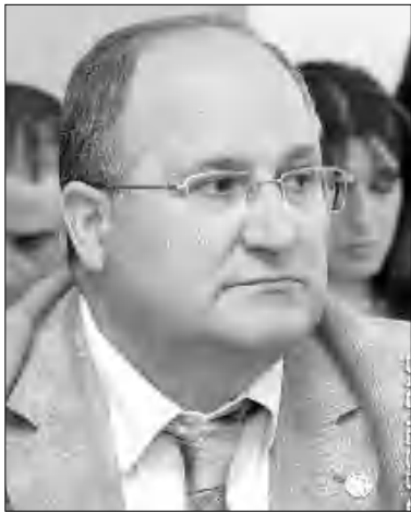
Ներկայացնելու, կարծում եմ՝ խնդիր մենք ինչ-որ չափով կլուծենք: - «Հայրուրով» վերջերս ժամանեք այն կարգերը, որտեղ նստակցություններ:

- Բազմաթիվ անգամ ասել եմ՝ ոչ իմ, ոչ հանձնաժողովի աշխատանքի նպատակը չէ բավարարել այս կամ այն կողմի ցանկություններն ու թախանջները: Մեր նպատակն է հնարավորինս, մեր կարողացածի չափով բացատրություններ տալ իրադարձություններին, որոնք ըստ էության սեղի են ունեցել բոլորի աչքի առջև, մեր ժողովրդի մեծամասնության համար բացատրություններ: Որ կլինեն մարդիկ, որոնց դա դուր չի գա՝ լինեն դրանք մեծապես մարմինների ներկայացուցիչներ, ընդդիմության լիդերներ, դա միանձանակ է, բայց նպատակը՝ ժողովրդի մեծամասնությունը ընդունելի զեկույց