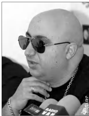
Տակ: Նման արտահայտություններ, ի դեմք, միայն Հայաստանում կան: Կրթվածության եւ ճաճակի դակասն է համասարած ռաթիսության դասձարը:

Կան մարդիկ, ովքեր կենդանի երգելու համար հրամանագրերի կարիք ունեն: Երգիչ կա, որ արք սարի երգելուց հետո, որեւէ էր գնալ վոկալի դասերի: Երբ 15 արի առաջ ձեւավորվեց «Էմփիթեյ» խումբը, մեմք որեւէ հրամանագիր չունեիմք, մեմք մեր ներսից հրաման ունեիմք չխաբել հանդիսատեսին: Հավաքական համերգներին չենք մասնակցում: Մեզ կոմեթրոն չեն համարում, մեմք էլ չենք երգի ոյուսի կան միմուսի