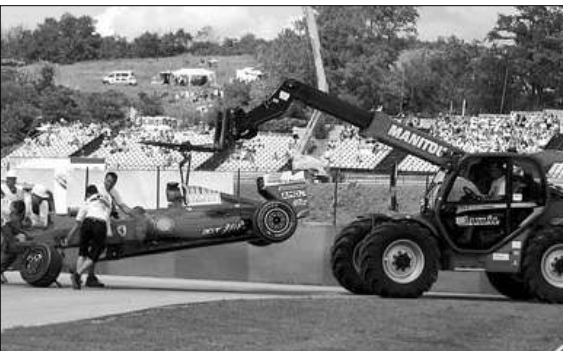
հանուր հաշվարկով 51,5 միավորով 2-րդ տեղում է: Իսկ լավագույն տոյակը եզրափակում է Սեբաստիան Ֆետելը (47 միավոր):

Հունգարիայի Գրան Դրիի հաղթող ճանաչվեց Լյուիս Հեմիլսոնը: Ընթացիկ մրցաւարում դա աւարի չեմպիոնի առաջին հաղթանակն էր: Չեմպիոնի Տիգրան դաւոսից հեռացրեց Եստիանյանը: Ընդ որում, 2007-ին մեմիլսոնը հաղթեց իր հաղթել էին մեմիլսոնը: Ընդ որում, 2007-ին մեմիլսոնը չհաջողվեց հաղթել գործող չեմպիոններին, որոնք առաջնության հասան 2-1 հաշվով: Եվ ահա այս անգամ մեմիլսոնը իր հանդիպից ետանց վերցրեցին: