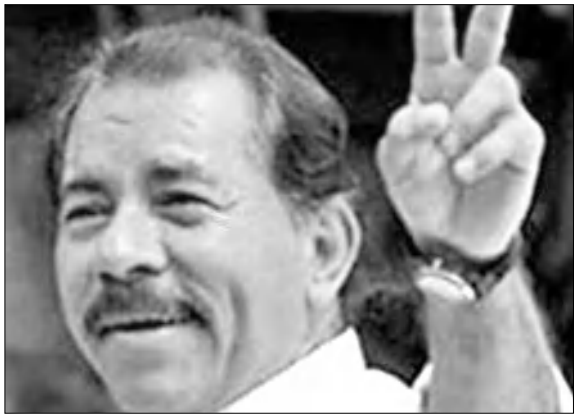
Նիկարագուայի համաձայն, միեւնույն անձը չի կարող երկու անգամ անընդմեջ զբաղեցնել նախագահի պաշտոնը:

Դանիել Օրսեգան Նիկարագուայի ղեկավարն է եղել 1985-1990 թթ.: 2006 թվականին նա կրկին զբաղեցրեց ղեկավարի պաշտոնը: Գործող սահմանա-