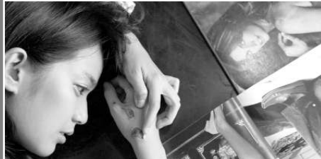
«ԿՈՒՅՐ ԽՈՉՐ, ՈՐԸ ՈՒՅՈՒՄ Է ԽՈՉՉԵՆ»

Տաղանդների հոլիվուդյան գործակալ ամբարտապան Ջոն Ռոսին ուղարկում են Գվաթեմալա՝ կրկնակի օսկարակիր Ջեյ Պալադինին զսնելու: Թեե նրանք երեք չեն հանդիպել, սակայն որոնումը հուզական երանգ ունի, քանի որ վաղուց աստիճանից հեռացած աստղ ժամանակին ամուսնացած է եղել Ջեյի հանգուցյալ մոր հետ: