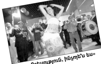
«Ցեսություն, ինչպե՞ս ես»