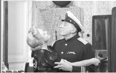
«ՄԵԿ ՈՒ ՆԵՆ ՄԵՆՅԱԿ»

Իրանի հարավային կղզիներում մարդիկ աղուսը վառակում են մաքսանենգությամբ: Գիտեն իրենց նավակներով կտրում են փոթորկուն ծովը՝ հոսալով խուսալ առափնյա ոսկանությունից: Ծովում հորը կորցրած զոյայի և հարսանիքի հաջորդ օրն ամուսնուն կորցրած համար աղջկա կյանքի դասնությունը միախառնվում է այն զոյամարդու ողիսականի հետ, որի կինը մտադիր է աղորիցի ճանապարհով հեռանալ երկրից: