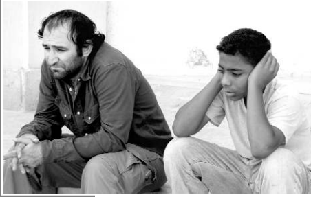
«ՆԱԳԻՍ ՄԱՆ ԵՒ ՆԱԳԻՐ ՄԵՉՆԵՐ ՅՈՐԸ»

Լինդան և Ջեյնոն հանդիպում են և նրանց ընկերությունը վերսկսվում է: Սալման հայտնում է «Կուռփի մոլորակում»: Ռոմին և Յանիան սեփական փորձ են ձեռք բերում: Օղան մեռնում է, և Լինդան Ջեյնոնի հետ ցրում է նրա արյունը: Ջեյնոն վերջապես սովորում է վեր նայել: