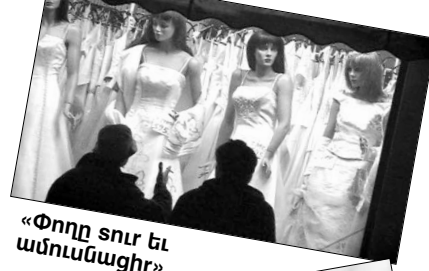
«Փողը տուր և ամուսնացիր»