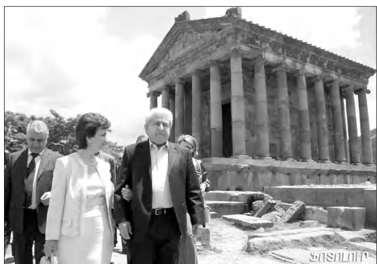
Կիորոսի Հանրապետության նախագահը և առաջին տիկինը Գառնիի հեթանոսական տաճարի մոտ:

- Թուրքիայի ղեկավարությունը իրեն ամեն կերպ փորձում է ներկայացնել որդես Կոլկասյան սարածաբանում նախաձեռնություններով հանդես եկող, խաղաղարար դերակատարություն: Որքանով են իրենք դրան հավասուն՝ կյանքը ցույց կտան, կյանքը կաղաքացույց: Ես գտաւ եմ, ունենալով սեփական փորձը Թուրքիայի որոշ նախաձեռնությունների առնչությամբ՝ նաեւ կիորոսյան հարցի առումով: