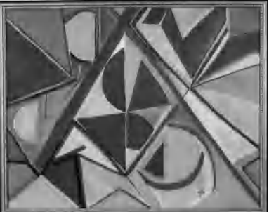
Ջուլիետա Ղազարյան «Ունայնություն ունայնություն»

Այս օրերին տեղի է ունենում Արցախի ժամանակակից նկարիչների ցուցահանդեսը: Բոլոր նկարներն էլ իմաստավոր են և լավ: Հասկառված կարելի է առանձնացնել Ջուլիետա Ղազարյանի «Ունայնություն ունայնություն» և «Տիեզերք» կտավները, ինչպես նաև Լեոնոր Զախարյանի Արցախյան բնադասկարները: Դրանք վրձնած են հյութեղ, թայծառ զուներանգներով և ակնհայտ են: