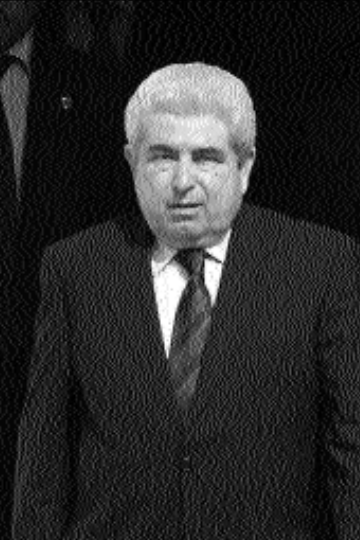
Մենք նաեւ մեր երկու երկրների առջեւ ծառայած խնդիրների առումով: Եվ դա ամուր հիմք է զարգացնելու մեր երկկողմ հարաբերությունները:

Կարծում եմ, շուտով մենք մեր ընդհանուր աշխատանքի բոլոր բնագավառներում այդպիսի համաձայնագրեր կստանալ: Մեր ֆաղափական հարաբերությունները շատ բարձր մակարդակի վրա են, միջազգային եւ սարածաշրջանային խնդիրների շուրջը դիրքորոշումների առումով եւս ընդհանրություններ ունեն: Ընդհանուր դիրքորոշում ու-