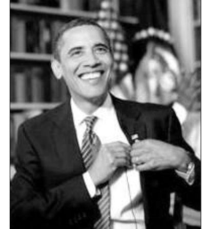
Գործակալության հնարավորությունների առնչությամբ Օբամայի արտահայտած լավատեսությունը: Նախատեսվում է նաև համաձայնագրի ստորագրության դեմ, կառուցողական համագործակցություն ծավալել Իրանի միջուկային ծրագրի հարցում:

ԱՄՆ նախագահ Բարաֆ Օբաման հուլիսի 6-8-ը դաժնունակ այցով կլինի Ռուսաստանում: Հինգշաբթի օրը նա բացառիկ հարցազրույց է արել ԻՏԱՌ-ՏԱՍՍ գործակալությանը և «Ռոսիա» հեռուստաալիսին: Ռուսական ՉԼՄ-ներին արված առաջին հարցազրույցում ԱՄՆ նախագահը խոսել է երկկողմ հարաբերությունների և երկու երկրների անեկիմների մասին, բնութագրել ՌԴ նախագահ Դմիտրի Մեդվեդևին և վարչապետ Վլադիմիր Պուտինին: Օբաման խոսել է նաև զինաթափմանն ուղղված ԱՄՆ ծրագրերի մասին: Օբամայի խոսքերով, ԱՄՆ-ը ձգտում է Ռուսաստանի հետ բոլոր հարցերի առթիվ հարաբերությունները կառուցել իրավահավասարության հիման վրա: Հարցազրույցը ռուսական հիշյալ լրատվամիջոցներով ամբողջությամբ հրատարակվելու է հուլիսի 4-ին, իսկ առայժմ հայտնի են վերաբերյալը և երկկողմ լայն համա-