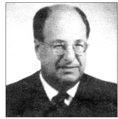
Դատավոր Մարկ Վուլֆ

Բոսնոնի շրջանային դատարանի գլխավոր դատավոր Մարկ Վուլֆը վճռել է կարճել մոտ չորս տարի ձգձգվող «Գրիգուրյան ընդդեմ Դիսկոլի» դատական հայցը, սեղեկացնում է Թոմաս Նեյը «Ամիսնյ» միտր սփեթթեր» շաբաթաթերթի հունիսի 20-ի համարում: Ըստ հաղորդագրության, «Ամերիկաբուրական ստեղծագործների ասամբլեան» (ԱԹԱԱ), ավագ դոկտորի 2 դասառուների և մեկ ուսանողի հետ 2005 թվականի հոկտեմբերին դատական հայց է հարուցել Մասաչուսեթսի կրթության վարչության (ՄԿԿ) դեմ բողոքելով խոսքի ազատության սահմանափակումների և հակացեղասպանական սեռակցների անսեռական համար: Խնդրի էությունն այն է եղել, որ ուսումնական ծրագրի «Ցեղասպանության և մարդու իրավունքների հարցեր» բաժնում ընդգրկված է եղել Հայոց ցեղասպանության վերաբերյալ նյութերի ուսուցումը: