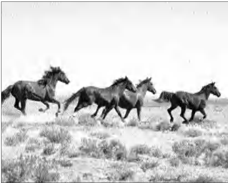
Ձիաբուծության, ֆան մինչ այդ հայտնի սկսվելու է:

Հնդեվրոպական մշակույթն ու լեզուն դառնալով ձիաբուծության ձիու օգտագործմամբ: Այսօրինակ հայտարարությունը կարող է ծիծաղելի թվալ կամ դառնալ ծիծաղի առարկա, սակայն սրվող բացառություններն ու փաստական հիմքը աղանդուցում են, որ բնավ էլ ծիծաղելի չէ խոսակցության թեման: