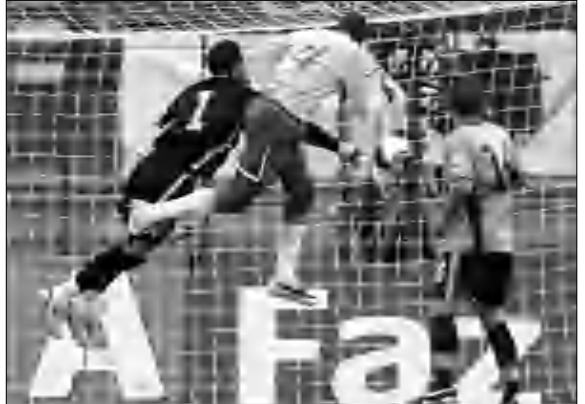
Գրաբովայի հավաքականը, որ 2007-ի Նոյեմբերին Սանտյագոյում 3-0 հաշվով ջախջախեց էր Զիլիի ֆուտբոլիստներին, սեփական հարկի սակ զիջեց մրցակիցին (0-2): Վեներ

Ֆուտբոլի աշխարհի առաջնության Հարավային Ամերիկայի ընտրական մրցաշարի հերթական տուրում անակնալ արդյունք գրանցվեց: Աշխարհի հնգակի չեմպիոն Բրազիլիայի հավաքականը հյուրընկալվելիս 4-0 հաշվով ջախջախեց ուրուգվայցիներին: Ոչ ոք նման արդյունք չէր ակնկալում, քանի որ ուրուգվայցիների կազմում էր հավաքականի ավագ, «Ոսկե խաղակոչիկ» դափնեկիր Դիեգո Ֆոռլանդը: Սակայն արդեն 2-րդ խաղակեսի սկզբում հանդիպման ելքը վճռված էր: 12-րդ րոպեին հաշիվը բացել էր Դանիել Ալվեսը, իսկ մինչև ընդմիջում ժուռնոլ երկրորդ գոլն էր խփել: 52-րդ րոպեին Լուիս Ֆաբիանոն 3-րդ անգամ գրավեց Սեբաստիան Վիեռայի դաշտում: Դաշտի տերերի ջախջախումն ավարտեց Կական իրացնելով 11 մ հարվածը: Բրազիլացիները գլխավորեցին մրցաշարային աղյուսակը: Իսկ ահա ուրուգվայցիներն ընթանում են 5-րդ տեղում՝ 5 միավորով հետ մնալով 4-րդ հորիզոնականում գտնվող արգենտինացիներին: