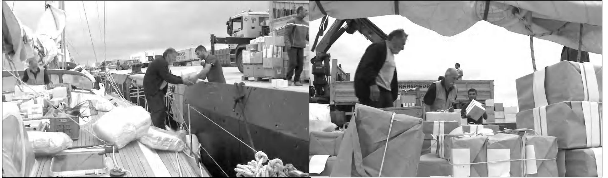
«Արմենիա» առաջատանավի անձնակազմը Սեուտեի (Իսպանիա) նավահանգստի քարափից նավ է տեղափոխում ուղեբեռները:

Օրես եւ կորցրի (այդպես անվանեցին ճանադարհային գողությունը) իմ հնամա «դիտարանը», որտեղ կային շատ արժեքավոր բաներ՝ անձնագիր, մոթաբեք, իմ հեռախոսագիրքը: