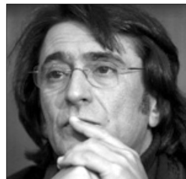
2008 թ.-ին նրան, իր նվագախմբի հեշ շնորհիվ եւ ամենաշատը նվագախմբի «Գեղանկար» մրցանակը:

«XXI-ի Գեղանկարներ» երաժշտական միջազգային փառատոնն իր գոյության ընթացքում հայաստանաբնակ ունկնդրին մատուցեց հաճելի անկնկալներ է մատուցում եւ նկրում բարձրակարգ դասական երաժշտության համերգներ: «Վիլնյուսը Եվրոպայի մեակույթային մայրաքաղաք» խորագրով համերգաւարը «XXI-ի Գեղանկարներ» 10-րդ երաժշտական միջազգային փառատոնի երջանակներում սեղի ունեցավ փետրվարի 12-14, մայիսի 3-ին եւ 4-ին կայացան դիրիժոր Վալերի Վերգինի եւ Մարիյան Թատրոնի սիմֆոնիկ նվագախմբի համերգները, որին մայիսի 6-9 ամիջադաշտե հաջորդեց «Գիս Կանչելիի օրերը Հայաստանում» համերգաւարը: Փառատոնի կազմակերպիչները արձանակում են նույն բարձրակետում գտնվող երաժիշտների համերգները եւ հունիսի 6-ին «Արամ Խաչատրյան» համերգաւարահում ելույթ կունենան աշխարհահռչակ Չորսի Բաւմետը «Մոսկվայի մեակույթային» կամերային նվագախմբի հեշ: Վերջին անգամ Բաւմետը այցելել է Հայաստան դարձյալ փառատոնի հրավերով չորս տարի առաջ: Բաւմետի տղայուհի կարիերային ավելացավ նաեւ այն, որ