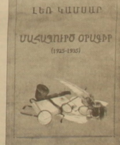
ԼԵՐԱ ԿԱՄԱՐԱՐ ՄԱՆԱՅՈՒՄՑ ՕՐԱԳԻՐ (1925-1935)

Լեռ Կամարի կյանը՝ չարտան տարիներ, իր գրականությունը, օրագրությունը, բացատրելի խիզախում է իր արտան ժամանակի առաջ և վկայություն է այն բանի, որ մարդու բարձագույն լիտեղը՝ ազատությունը իրեն բացատրելի հոգեվիճակ յուսահանյուր կում է իր մեջ, որը կամ արտահայտում է, կամ ոչ: Այդ դրստումը չեն կարող արգել ինչն ոչ դասական իրավիճակը, ոչ ժամանակագրանը, ոչ հասարակարգը, ոչ էլ վարչակարգը: Բայց սա անհասնելի դասագրություն, նրանց ուլիք դասարանացուցություն են կում իրենց ժամանակի, սեփական խղճի հանդեր: Այս 37-ի մթնոլորտի, բարտարությունն ու մարդկային նկատագրի վերանայումն քանակիտային քառերում կրել են թեթեմ: Ահալակի մի գրող, մարդ, ու երբեք չեմ սուր չի սվել ռեալ դասարանում՝ մեռնի և արտարվել է միայն ծեծարությունը: