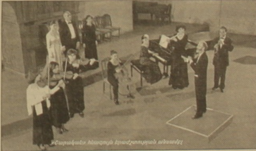
Շաղախան հնագույն երաժշտության անսամբլը

թյունը: Մի հաւելար կա արված, որ հայ ժողովրդին աշխարհում 70 տկոսով ճանաչում են Արամ հաչատրյանով, ոչ թե «հայերի խորհրդարանով» կան սնտեսակն 12 տկոս անով: Մաւոնցի ժամանակ հաւել տկոս է եղել սնտեսակն անը, հանի տկոսը է եղել, ով է հիւում: Բայց տաներ են մնացել: Եթե մշակույթը արդարաւրեւ կան է այսու, տաներ էլ կարող են արդարաւրեւ «քարնացնել», «հեծսացնելու» նույնակով, ոչ, ճ, Ե-ն ուն են ռեթ, կարող են չլ մի օր մասնել: Ինչպէս այսուրեւ են համակարգված, այնուր էլ՝ երաժշտությունը: Արդեւ նախկինում էր դաիդանել ուրակի մեւ, ասում է փիլիսոփան: Իսկ մշակույթների, արթըր տեւերի արվեստների խառնուրդը, որ անում են այսու, հորմաֆորիսիզմ է, սա չփոթեւ դասական օրինակների հեծ, ինչպէս օրինակ իսպանական թեմայով Պազանիինի կարդիս, իսկ Ռախմանինովը ռադարդիս են գրել: Դա հանձնարել մարդկանց երկխոսություն է եւ չոթե է համարել, եր ժողովրդականը ասելի խառնում են խոր տաների հեծ: