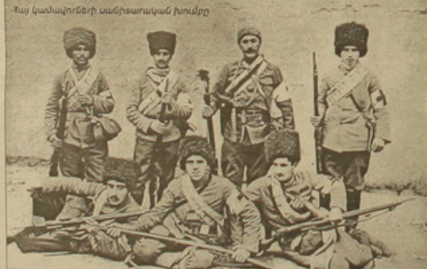
Հայ կամավորների սանիտարական խումբը

Վիճակը ավելի էին ծանրացնում նրանց կեցության հակահիգիենիկ լիարժեքներն ու համաճարակ սովը: Գաղթականների կոտորածները վարչություն օրական հարյուրավոր մարդիկ էին մեռնում: Վարդապետի փորձերը լի էին դիպակներով, և դիտարկները չէին հասցնում հավաքել ու թաղել մահացածներին: