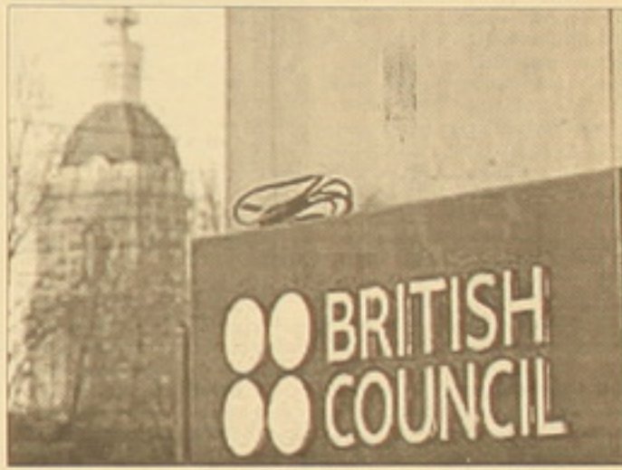
աշխատակիցները անվանագրությունը... Բայց Մոսկվայում բրիտանական դեսպանությունը հայտարարել է...