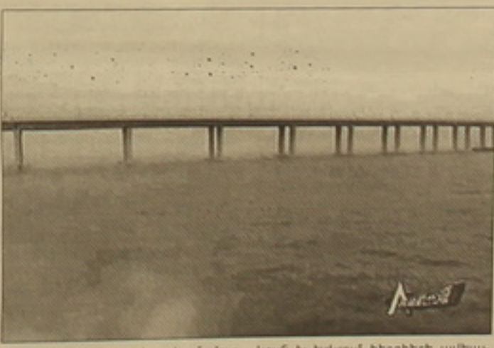
արողական եւ էկոլոգիաթե մախուր հողալ:

Չինաստանում երկր բազվել է աշխարհի ամենաերկար ծովային կամուրջը: 36 կիլոմետրանոց բավական լայն կամուրջը (6 օար) միացնում է Արեւելաչինական ծովի Հան Չժոու-վան ծոցի երկու ափերը, Եանհայը կաթելով Լիներ խոուր նավահանգստին: Սինհուա գործակալությունը նում է, որ վիթխարի կամուրջը կառուցվել է նվազ հան հինգ տարվա ընթացում: Ալելալվում է, որ կամուրջը շուտով կդառնա տառածաբանի գլխավոր դիտարման վայրերից մեկը: Մայիսի վերջերին կամուրջով կարելի Պեկինի օլիմոպիադայի քաղը: Ի դեմ, օլիմոպիադայի նախօրեին ԾժԿ իջխանությունները երկում ծխելու սահմանափակումներ են մեցնում: Հինգաբթի օրվանից ծխելու արգել է սահմանված Պեկինի հասարակական վայրերում: BBC-ն նում է, որ իջխանություններն ուզում են մինչե օգոսոս Պեկինը դարձնել