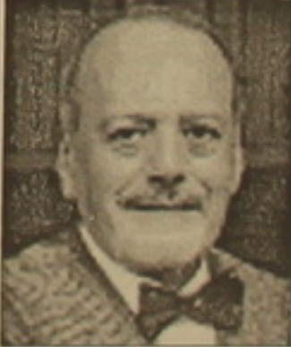
Թուրքիայի ազատ մասունների մեծ վարդեր

Ապրիլի 24-ին Փարիզի Կոմիսիայի արձանին հարող Կոնկորդի հրապարակում Հրանսիայի նախաձեռնությամբ կազմակերպված Սեբ Երեմի գոհերի ոգեկոչման համահավաքին Հրանսիայի Մասունական Սեբ Արեբիլ օթյակի մեծ վարդեր ժամ-Միսել Բիլյարդի մասնակցությունն ու առավել նա ժխտողականության համար թուրքական իշխանություններին դաժանաբող խիստ ելույթը ծանր կացության մեջ էին դնել թուրք մասուններին: Ելույթի արժեքները հասկարդես անհանգստացել էր Թուրքիայի ազատ մասունների մեծ օթյակը, որովհետև ներկայացնում է Հրանսիական դրոշմը, իսկ մյուսը՝ Թուրքիայի ազատ և ընդունված մասունների մեծ օթյակը, առանց այդ էլ խճճված է ներքին խնդիրներով: Ավելին, երկու սարի առաջ այցելելով Թուրքիա՝ երկուսն էլ Հայոց զեղադրությունները մասնակցանք