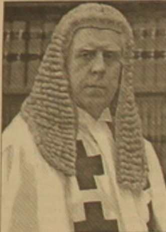
Մալլեակին դեկավարում էր Յոն Ամիթի հիմնադրանը, որը միջազգային ասղարեզում ամենահայտնի եւ բարձր վարկանիւ ունեցող կատակարման եւ ժողովրդականական արծեների սարածան կազմակերպություններից մեկն է։ Այս հիմնադրամի ցրգանակներում է, որ Չերչիլի լորդը գերեւ ամեն սարի այցելում է Հայաստան։ Լորդ Մալլեակին Լորդերի դայքարի հայամես ակեթիլ գործիչներից է։ 2007-ի աշունը ԳԳ վճարել դասարան այցելության ընթացում դասարանի նախագահի եւ լորդի փոխանակման վերաբերյալ։ 2008-ի աշունն ակնկալվում է Միացյալ Թագավորության վարչադաշնրի խորհրդական լորդ-բարոմ Յոն Մալլեակինի հերթական այցը Հայաստան։

Մեծ Բրիտանիայի ամենահայտնի իրավագետներից մեկը՝ Չերչիլի լորդ, ցմահ բարոմ, լորդ Յոն Գերբերտ Մալլեակին նշանակվել է Մեծ Բրիտանիայի վարչադաշնրի խորհրդական։ Հարող Ուիլսոնի կատակաբանությունում զբաղեցնելով աղարարության նախարարի դասուհանր լորդ Մալլեակին վարել է երկրի ամենահայտնի իրական գործերը։ Բարոմ Մալլեակին դեռեւս երեսասարղ սարիում Փոլ Մալլեակինի դասուհանր դասուհանր էր, երբ «Բիթլզ»-ը զեմվում էր իր փառի զազաթնակեթին։ 1974-1979 թթ. լորդ Մալլեակին իր մեթիմ ընկերոջ՝ Եյորիսոնի արաջնորդ Յոն Ամիթի հեւ համատեղ մեակել եւ անցկացրել է Ըոչլանդիայի իմնակարության օրենսդրությունը, որ անկունախարային հանգրվան է Մեծ Բրիտանիայի դասուհանրության մեջ։ Վերջին սարիներից լորդ