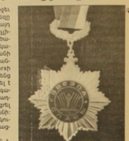
Ֆիլմը, իսկապես սաղանակալոր դե-րակատարում: Ավստրիայի, ինքնաստա-նություն գործը: Այլա Ռուսասանը: Ել ում ասել: Ռեզիմեն Ժողովրդա-յին՝ քաղաքականի, արվեստարան: