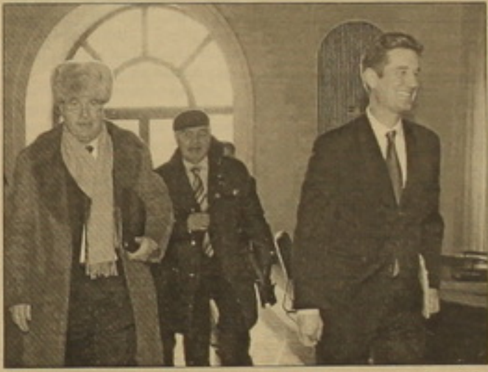
Յուններ, անցյալ սարածաւրջան Մարտիկում Հայաստանի եւ Ադրբեջանի ԱԳ նախարարներին հանձնված թարմացված փաստաթղթի ո-

ՄԱՍՏԱՆԻ ՀԱՐՈՒՅՑՈՒՄԸ Հայաստանի եւ Ադրբեջանի նախագահներից յուրաքանչյուրն ունի իր կոչւոս դիրեկտուրը, բայց, միաժամանակ, նրանք, կարծես դասուհանր են ընդհանուր լեզու գտնել։ Լրագրողներին նման հայտարարություն է արել երեկ Երեւանում ավարտված «Ընդլայնված սեփական սարածաւրջան, միջազգային եւ սարածաւրջանային անվանգուրջան հեռանկարներ» միջազգային երկրորդ գիտատրոլի մասնակից, ԱՄՆ ղեկավարող զինուորականի սեղակալ, ԵԱԴԿ Միննիսի խմբի անդամներից համանախագահ Մեթյու Բրայզան։ Ըստ անդրկազմի համանախագահի, համանախագահներն աշխատում են նույնպէս երկու նախագահների միջեւ կարծիքների փոխանակմանը, բայց կանխատեսումներ անել չեն կարող։ Մինչեւ հայաստանյան նախագահական ընտրու-