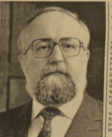
Դում, որ ծագումով հայ եմ, արյուր չեմ մսանել Արյուրի 24-ն էլ նյութ դարձնելու:

Ես, հողված, խմբից հետանում եմ, այլեւս չեմ լսում խոսակցության զարմանալույթունը եւ մսանում եմ. «Արյուր ունի է մարդկանց հիշեցնել իրենց բարոյական յուսատեսու- քյունը»: Ես դա երբեմ չեմ արել, որովհետեւ ե- թե դիմացինը քերտում է, ուրեմն այդ զա- ղողությունը չունի: