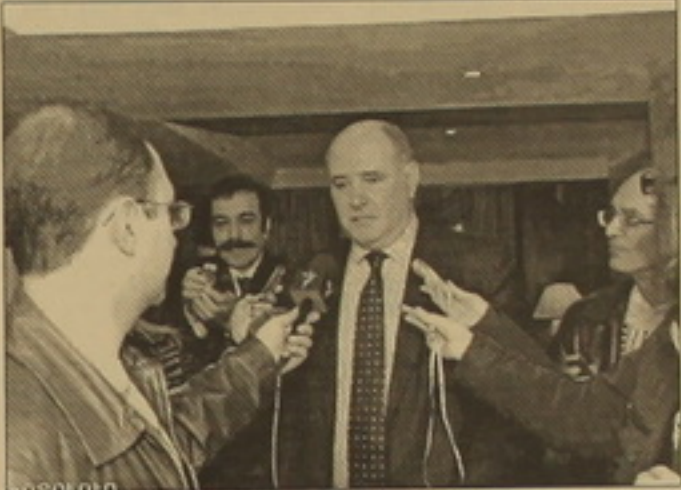
Վելու կառուցողական ընդդիմությանը իրավական դաշնակցություններին և հույս հայեցող, որ այս միտումը կզերակծի և հայ հասարակություն կվերադառնան կայունությունը, կամիասենսիությունը:

Մարտի 18-20-ը Հայաստանում երգանում Ռուսասանի ղեկավարությանը, փոխարհգործնախարար Գրիգորի Կարասինը: Երեկ մեկնումից առաջ «Արմենիա-Մարիո» հյուսանոցում հայասանյան լրատվամիջոցներին Կարասինը տեղեկացրեց, որ կարևոր հանդիպումներ է ունեցել Հայասանի ղեկավարությանը՝ նախագահի, վարչապետի, արհագրաբանության հետ: Բնակարանային լրատվամիջոցներին հարցերից Կարասինը ասանումացրեց երկրորդ հարաբերությունների համալիրը, որ կրում է ակտիվ բնույթ, ուղղված է արագացման: Այդ հարաբերություններն ակտիվորեն զարգանում են հարաբերական, մակրոպային, կրթության ոլորտներում: «Մի խոսքով, մենք մնում ենք դաշնակից երկրներ և ռուսություններ են վերաբերվում մեր հարաբերությունների բոլոր ոլորտներին», նեց ՌԳ ղեկավարությանը: