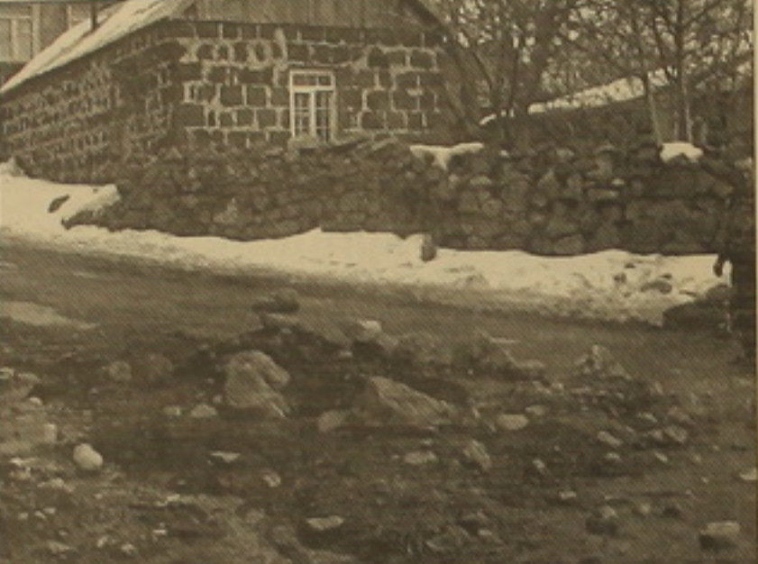
Վթարված գաղազար խողովակից արհեստական զազը տեսանական լուրջ է Ա. Գալստյանի տունը

Գաղազարի ստուգումների մասին համայնգետեց Բարդա Սարգսյանը ոչինչ չիտեց, բայց եւ չբացատրեց այն: Միաժամանակ նեց. «Մեծ չեմ իմացել, բայց զոնե երբ քաղի բնակիչները կիմանալին»: Երկրորդ մայրցամաքից հետո համայնգետեց անձամբ էր «Յայրուսզգարդի» տեղի մասնաճյուղին դիմել, ներկայացրել հիվանդանոցի վիճակը: «Ասացի՛ մարդիկ վազ վիճակում դառնեմ են, զոնե նյութական աջակցություն ցույց զվել, իրենք քե՛ մեծ ոչ մի բան էլ չեմ տկախ, արքեր հիվանդանոց, ինչ ծախսեր կլինի՛ մեմ կանեն: - Պասմեց Բ. Սարգսյանը: